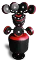
Opcional Kick Pad