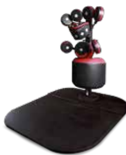
Torre BoxMaster® con Base